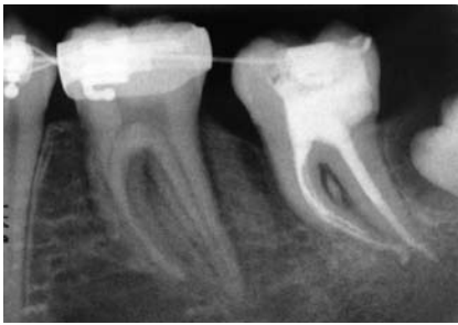
Abb. 3: Unmittelbar nach WF im August 2006 mit Feilen-Fragment im mesiovestibulären Wurzelkanal bei klinischer Beschwerdefreiheit.