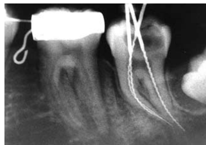
Abb. 2: Messaufnahme im April 2006.

Gerade in derart unglücklich verlaufenden Fällen sind wir natürlich heilfroh, über ein Endodontie-Protokoll zu verfügen, bei dessen strikter Anwendung wir – insbesondere auch den erschrockenen Eltern gegenüber – mit gutem Gewissen voraussagen können, dass es trotz dieser unerfreulichen Komplikation mit einer Wahrscheinlichkeit von sehr, sehr nahe an 100 % nicht zur Ausbildung eines Granuloms mit möglichen